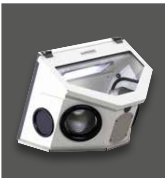
Absaug-Box Compact III mit Zubehör Satz Schutzblenden mit Durchgreifstulpen und separaten Öffnungen für das Handstück