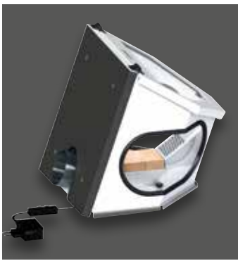
Absaug-Box Compact III, Standardausführung mit seitlichen Eingriffsöffnungen, geräumigem Innenvolumen und einem umsetzbaren Absaugstutzen (Montagemöglichkeiten vorne und hinten)