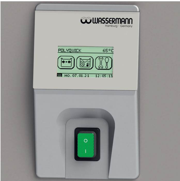
Selbsterklärende Symbole, schnelle und einfache Menüführung