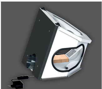
Absaug-Box Compact III , Standardausführung, der Absaugstutzen ist umsetzbar und kann wahlweise vorne oder hinten am Gerät montiert werden