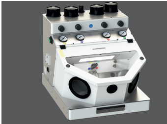
Cemat-4 II (auch als 3- und 2-Kammer-Ausführung erhältlich)

Die Kombination unserer Niederdruck-Absauganlagen mit der Absaugbox oder den Feinstrahlgeräten gewährleistet einen hervorragenden Gesundheitsschutz und höchste Wirtschaftlichkeit. Das passende Strahlmittel erhalten Sie ebenfalls von Wassermann.