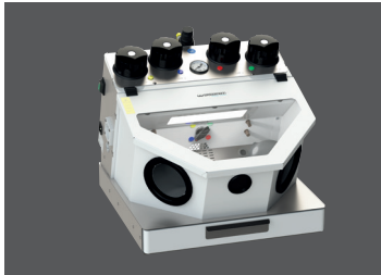
Gobi Comfort-4 (auch als 3- und 2-Kammer-Ausführung erhältlich)