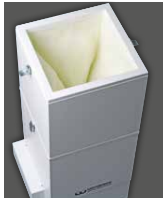
SG-10 Basis mit Modul Aktivkohlefilter