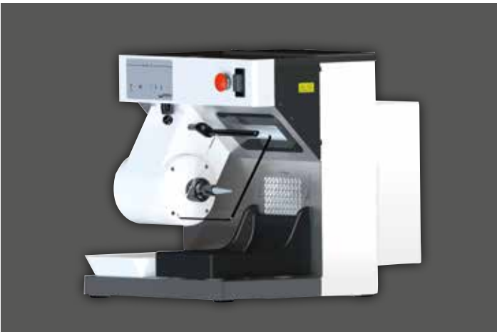
WP-Ex 10 II mit Sonderzubehör Ansaugschutzgitter