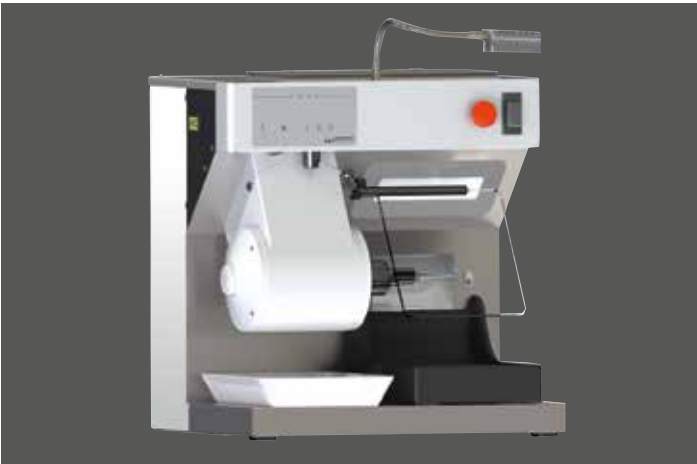
WP-Ex 10 II mit Sonderzubehör Tageslicht-LED-Spot