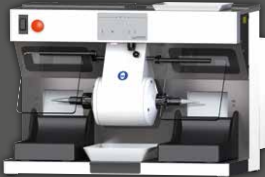
WP-Ex 2000 II (2 Schaltstufen, 1500 / 3000 min -1 ), Grundausrüstung

Wassermann Dental-Maschinen GmbH Rudorffweg 15-17 · 21031 Hamburg · Deutschland Tel.: +49 (0)40 730 926-0 · Fax: +49 (0)40 730 37 24 info@wassermann-dental.com · www.wassermann.hamburg