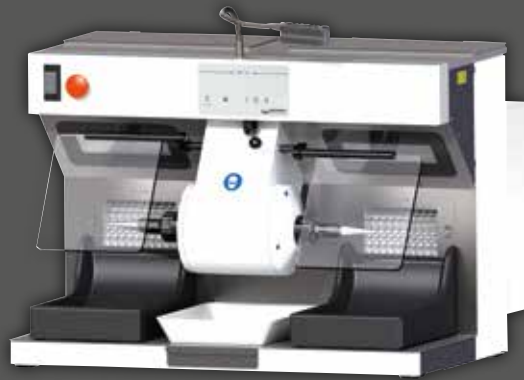
WP-Ex 2000 II mit Sonderzubehör Tageslicht-LED-Spot und Ansaugschutzgitter