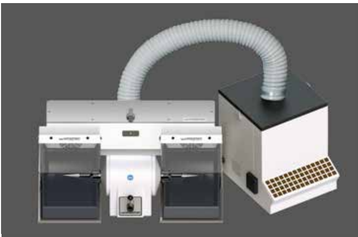
WSM-2 mit Zubehör und Niederdruck-Absauganlage SG-1/1