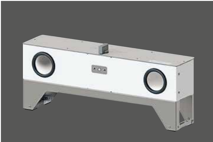
Absaugtraverse II für 2 Poliertröge, inkl. Luftweiche und einem Ausgangsstutzen für eine externe Absauganlage