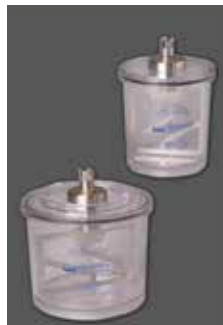
600 ml und 350 ml