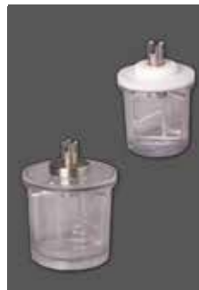
200 ml und 75 ml

Wassermann ist ein inhabergeführtes, mittelständisches Unternehmen mit Firmensitz in Hamburg. Wir konstruieren und produzieren hochwertige technische Geräte in Deutschland. Hauptanwender sind weltweit zahntechnische Labore, Zahnarztpraxen und unterschiedliche Industriebereiche.