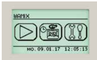
Touchscreen für schnelle und einfache Handhabung