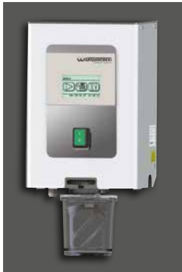
Wamix-Touch/ Wamix-Touch Injector, Wandmontage

Wamix-Touch Injector: Mit diesem Verfahren wird das Vakuum selbst bei großem Volumen sehr schnell erreicht und spart somit Zeit. Der öl- und wartungsfreie Vakuumerzeuger erreicht zuverlässig einen hohen Wirkungsgrad. Ein Druckluftanschluss ist erforderlich.