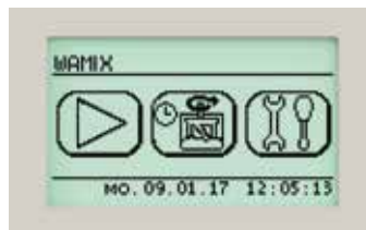
Touchscreen für schnelle und einfache Handhabung