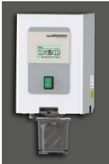
Wamix-Touch/ Wamix-Touch Injector, Wandmontage

Wamix-Touch Injector: Mit diesem Verfahren wird das Vakuum selbst bei großem Volumen sehr schnell erreicht und spart somit Zeit. Der öl- und wartungsfreie Vakuumerzeuger erreicht zuverlässig einen hohen Wirkungsgrad. Ein Druckluftanschluss ist erforderlich.