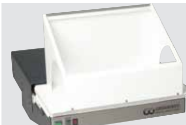
LSG-02 DE mit Universalsaughaube