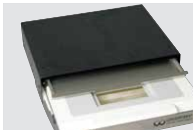
LSG-02 DE mit Zwischenschublade