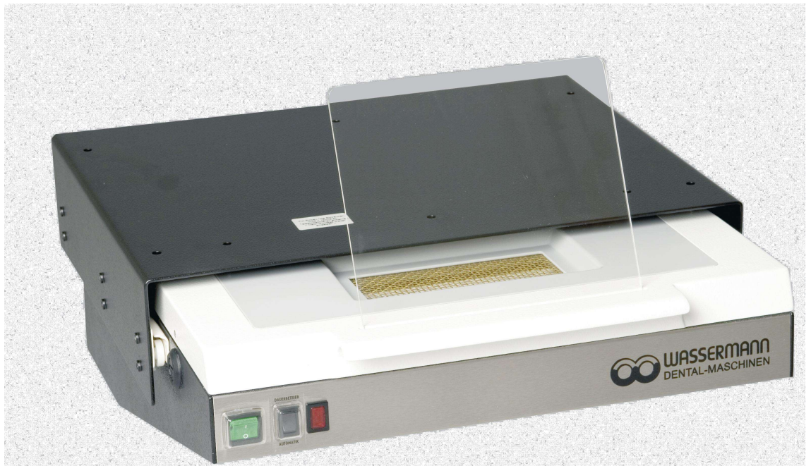
LSG-02 DE mit Einschaltautomatik