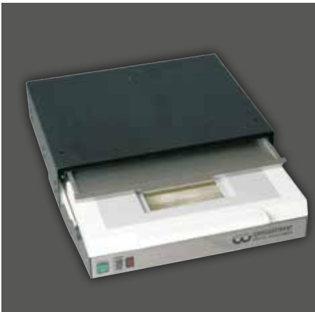
LSG-02 mit Zwischenschublade