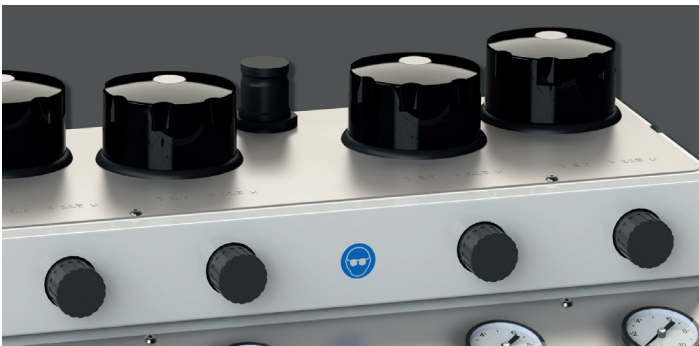
Strahlkammern mit individuellem Arbeitsdruck, 0,8–6 bar