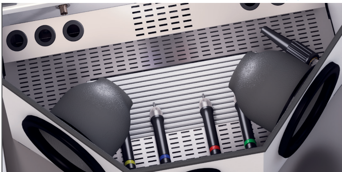
Ergonomische Strahlgriffel und separate Ausblasdüse