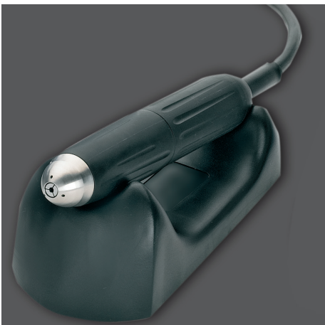
Extrem leistungsstarkes Motor-Handstück mit einer gleichmäßigen Drehzahl und einer überragenden Laufruhe