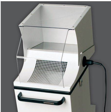
Timobil inkl. Zubehör Saughaube