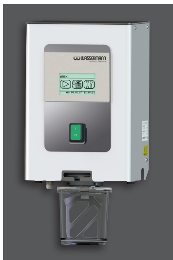
Wandmontage, Befestigungsset im Lieferumfang enthalten

Wamix-Touch Injector: Mit diesem Verfahren wird das Vakuum selbst bei großem Volumen sehr schnell erreicht und spart somit Zeit. Der öl- und wartungsfreie Vakuumerzeuger erreicht zuverlässig einen hohen Wirkungsgrad. Ein Druckluftanschluss ist erforderlich.