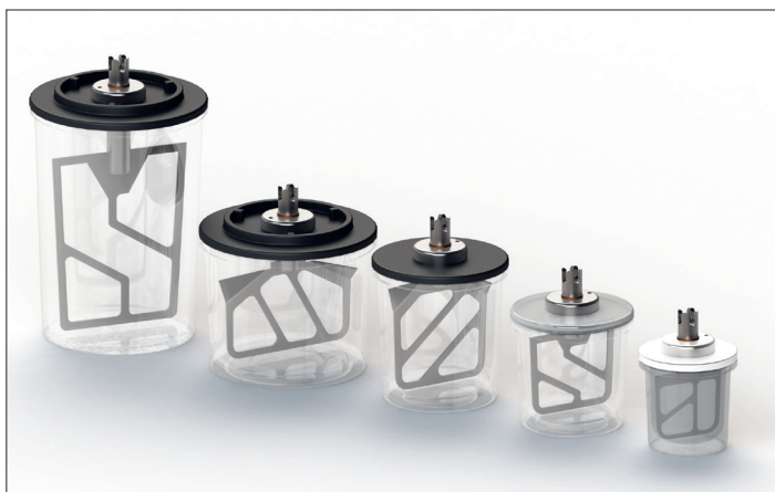
1000 ml, 600 ml, 350 ml, 200 ml und 75 ml