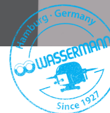
Ausbrüh- und Polymerisationsautomat