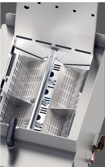
Komfortabler Ausbrühvorgang, freier Zugang zu den Küvettenkörben