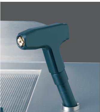
Handbrause zum manuellen Ausbrühen